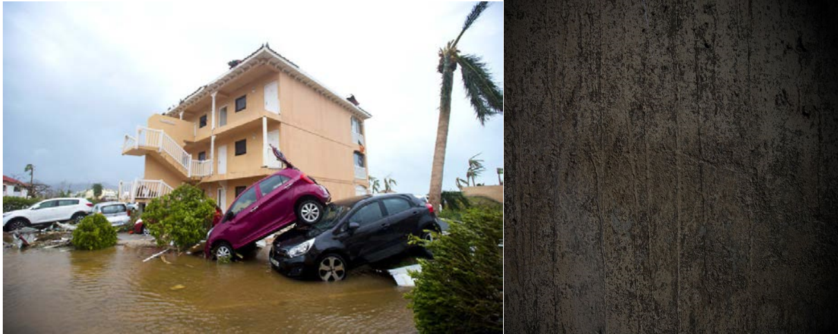
Hurrikaani Irman aiheuttamia tuhoja.

Hän sanoo tuossa sananpaikassa, 1. Tessalonikalaiskirjeen luvussa 4:16-17, että Arkkienkeli tulee antamaan ilmoituksen, käskyn. Arkkienkelin ääni tulee huutamaan HERRAN tulemuksen. Julistaen, että: Katso, HERRA on lähestymässä. Ja olen antanut tämän, nuo tarkat sanat. Olen Puhunut maailman kansakunnille suorassa lähetyksessä, että tiedän nuo tarkat sanat, jotka hän tulee sanomaan. Hän tulee sanomaan: Katso, HERRA on juuri ilmestymäisillään taivaalla. Olen juuri antanut teille nämä tarkat sanat. Arkkienkeli tulee käyttämään sitä ilmoittaen osallisille, pyhille, kuolleille pyhille, jotka on nyt nostettu ylös kuolleista, ja myös eläville pyhille, jotka tullaan muuttamaan, heille, joilla on hengelliset korvat, ja jotka tulevat kuulemaan tämän Äänen. Hän sanoo, että Hän tulee käyttämään sitä antamaan ilmoituksen, että: Katso, HERRA on nyt lähestymässä. Katso, HERRA on tulossa. Oi! Hän tulee antamaan ilmoituksen Hänen Loisteliaan Kirkkaasta ilmestymisestäään suuressa voimassa. Että Pelastaja on tulossa. Lunastaja on tulossa.