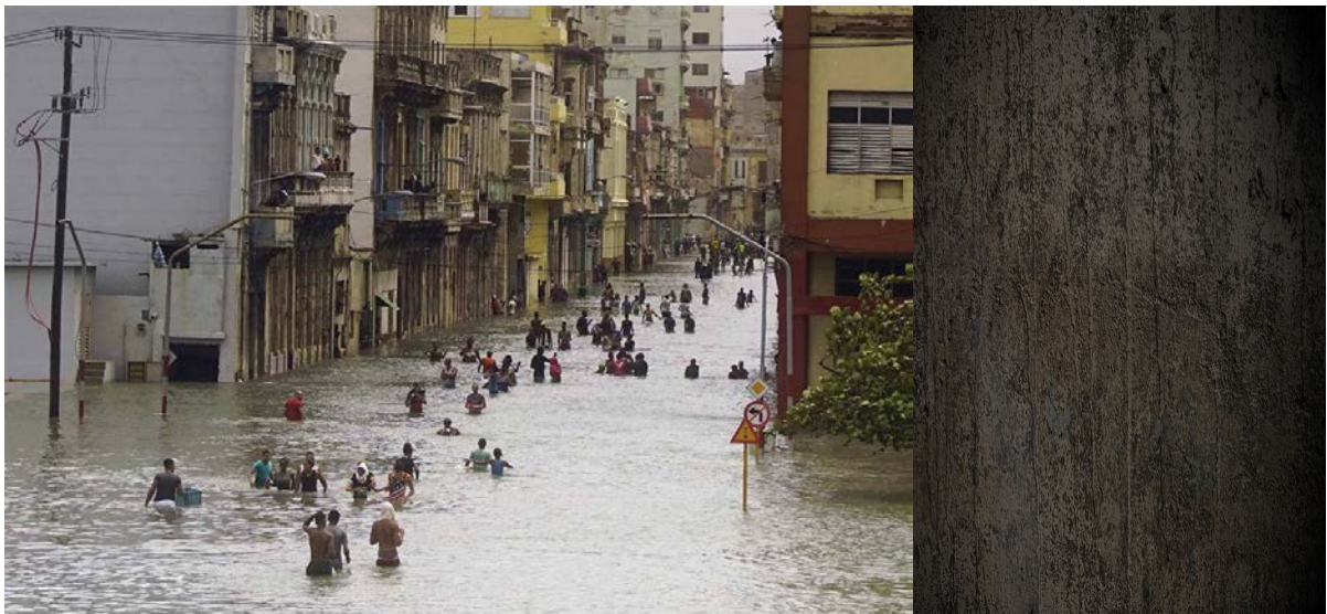
Hurrikaani Irman aiheuttamia tulvia.