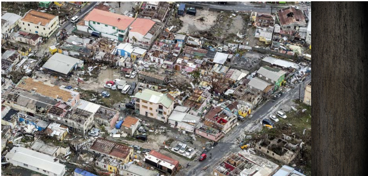
Hurrikaani Irman aiheuttamia tuhoja.

Tämä on taas toinen kerta, kun Hän lähti heidän luotaan hetkeksi, ja sitten yhtäkkiä Hän tulee alas. Hän kysyy, kuinka kauan he jatkavat tämän kapinan tornin rakentamista Floridassa, Miamissa, Tampassa? Kuinka kauan he jatkavat tämän kapinan tornin rakentamista Barbudassa, Puerto Ricossa, Dominikaanisessa Tasavallassa, kaikissa näissä niin sanotuissa paratiiseissa. Paratiisi-saarilla, seksuaalisynnin paratiiseissa, aina Florida Keysissa saakka. Kuinka kauan te jatkatte tämän kapinan tornin rakentamista Teksasissa, Dallas Teksasissa, Houston Teksasissa, Amerikan Yhdysvaltojen seurakunnissa? Kuinka kauan aiotte jatkaa tämän kapinan tornin rakentamista, jossa naiset pukeutuvat, miten huvittaa seurakunnassa, jossa pastorit saarnaavat maailmallista evankeliumia, jossa homoseksuaalisuus on sallittua, jossa ihmiset voivat asua yhdessä ilman avioliittoa, valheissa, tällaisessa maailmallisuudessa, jota harjoitatte siellä. Kuinka kauan aiotte jatkaa tätä?