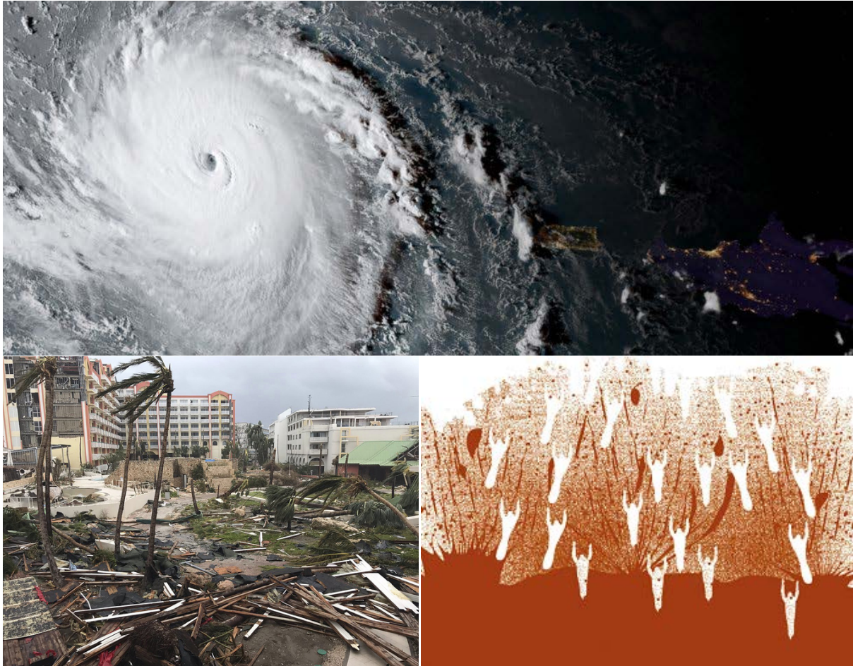
Hurrikaani Irma ja sen aikaansaamia tuhoja.

MIKSI HERRA JUMALA KAIKKIVALTIAS TUOMITSI ANKARASTI USA:N HURRIKAANI HARVEYN JA HURRIKAANI IRMAN KAUTTA?