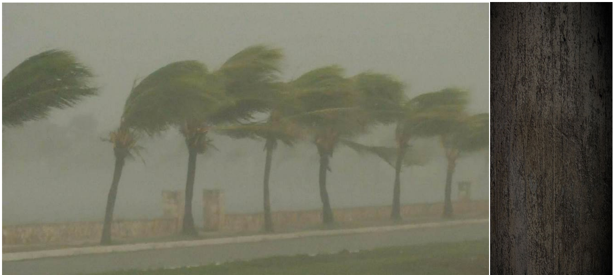
Hurrikaani Irma ravistelee Floridaa.

kaikista heistä, jotka ovat unessa. Pelastuksemme toivo. Se syy, miksi sanon, että on sen arvoista, että USA:ta ravistellaan myrskyllä, hurrikaanilla, jos se vaati sen, jotta he kuuntelisivat tätä Ääntä, joka kehottaa parannuksetekoon ja synnistä pois kääntymiseen ja Pyhän Hengen vastaanottamiseen; vanhurskaudessa kävelemiseen ja pyhyiden syleilemiseen ja tien valmistamiseen sydämessäsi MESSIAAN Loisteliasta Tulemusta varten. Se on sen arvoista. Hän sanoo, että se on sen arvoista. Se on sen arvoinen kutsu. Sillä Hän sanoo, että vaikka jos kuolisitkin nyt ennen kuin MESSIAS tulee, jos noudatit tätä Ääntä, silloin kaikki on hyvin. Sillä Hän sanoo, kun KRISTUS nostettiin kuolleista, Hän nousi kuolleista, niin Hänestä itseasiassa tuli Ensihedelmä unessa olevien joukosta, heidän, jotka ovat kuolleet. Hei!