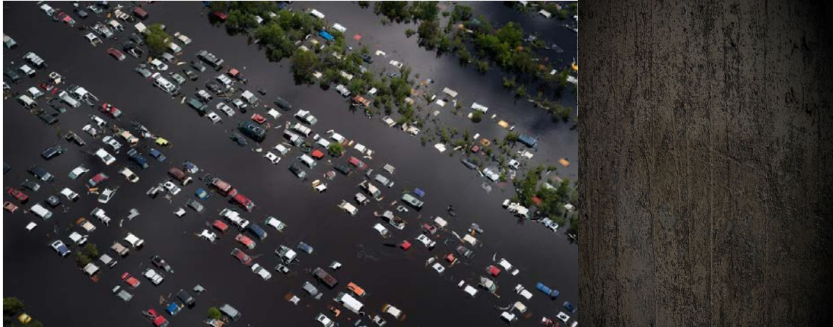
Hurrikaani Irman aiheuttamat tulvat.

näytti minulle seurakunnan yläilmoissa maapallon yläpuolella suuressa onnitelussa, riemuitsemisessä ja juhlimisessä, kun he valmistautuivat menemään sisälle Taivaaseen. Tämän juhlinta, joka on juuri tapahtumaisillaan maapallon yläpuolella, on se syy, miksi HERRA ravistelee kansakuntia. Shalom Shalom. Toda raba.