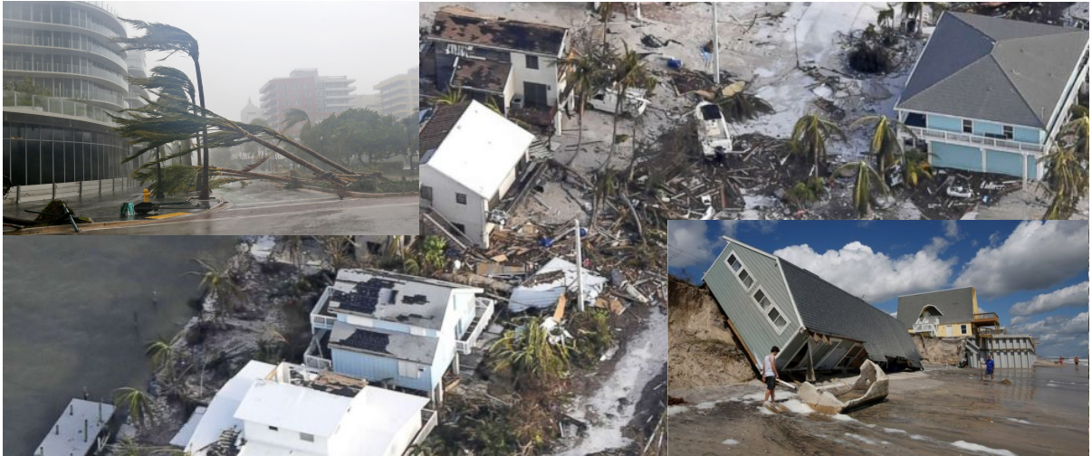
Hurrikaani Irman tuhoja Floridassa.

veden tulevan maasta, tarkoittaen katutasolta. Ehkä on myös sadetta myöhemmin, mutta puhuin maasta. Sitten Hän kutsui valtameren. Ja sitten näet valtameren tulevan ulos. Kun sanoin, että näen tornadoja, sitten näet tornado-vahteja, ja useita tornadoja kosketti maahan Floridassa. Hän sanoo, että Hän ravistelee kansakuntia.